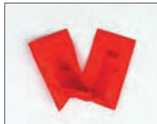
Winkelverbinder und Maueranker werden lose beigelegt