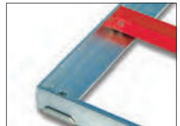
Rote Winkelprofile dienen als Einbauhilfen bei Rahmen über 2 m Seitenlänge