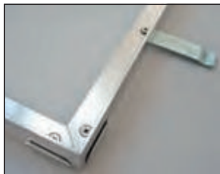
Winkelrahmen mit Eckverbinder und Maueranker (Lieferung ohne Montage)