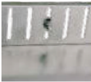
Höhenverstellung Beispiel 1