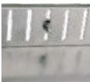
Höhenverstellung Beispiel 1