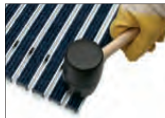
Neue Ripsstreifen mit Selbstklebeband in das Aluprofil einkleben und ggf. mit einem Gummihammer den Klebprozess verstärken.