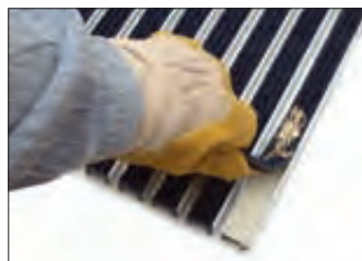
Wichtig: Schmutz, Rips und Klebereste vom Aluprofil entfernen (z. B. mit einem Stechbeitel).