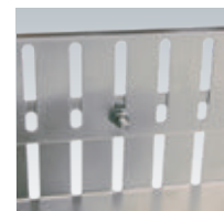
Höhenverstellung Beispiel 2