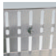
Höhenverstellung Beispiel 2