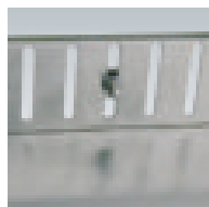
Höhenverstellung Beispiel 1