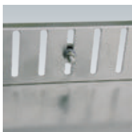
Höhenverstellung Beispiel 1

Stanzloch: 60 mm Durchmesser, Mehrpreis je lfdm. = 1,67 €.