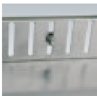
Höhenverstellung Beispiel 1

Stanzloch: 60 mm Durchmesser, Mehrpreis je lfdm. = 1,76 €.