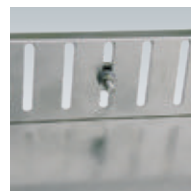
Höhenverstellung Beispiel 1