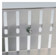
Höhenverstellung Beispiel 2