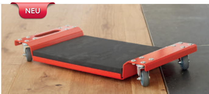
myRolly - der professionelle Helfer bei Bodenarbeiten Aluminiumgehäuse, optimale Beweglichkeit