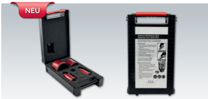
Diamantbohrkronen-Set bestehend aus 4 Bohrkronen