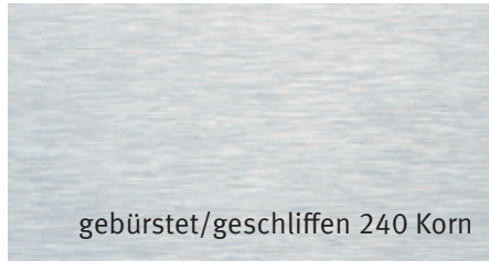
gebürstet/geschliffen 240 Korn