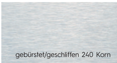
gebürstet/geschliffen 240 Korn