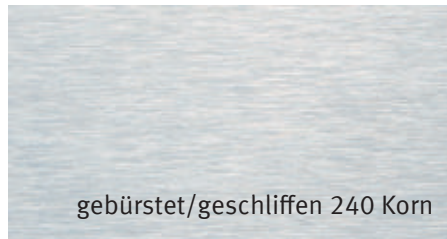
gebürstet/geschliffen 240 Korn