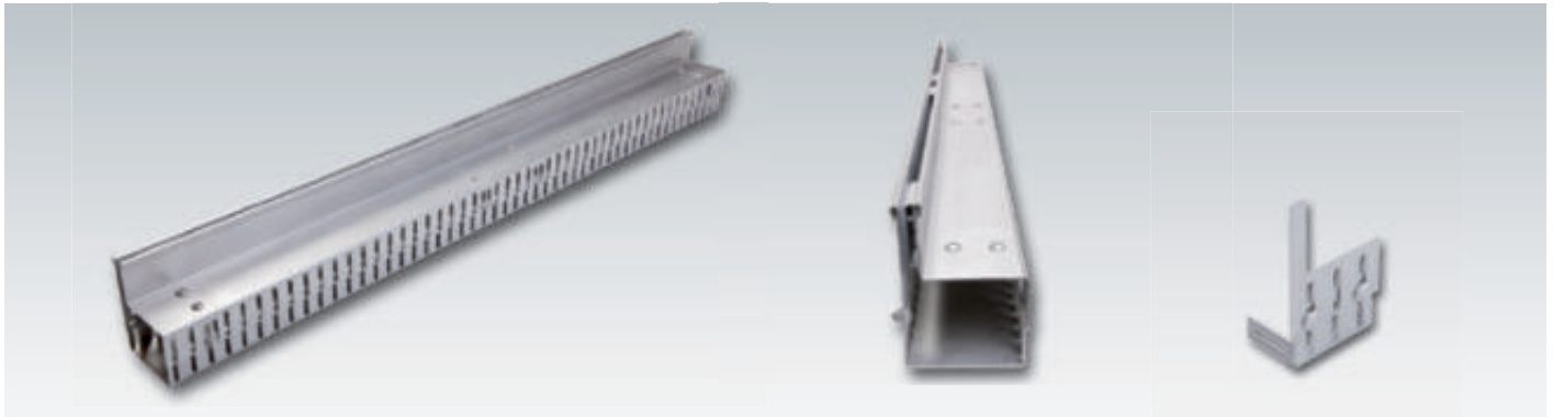
Schlitzrinnen Lumina aus Edelstahl V2A (höhenverstellbar), 1,5 mm Materialstärke